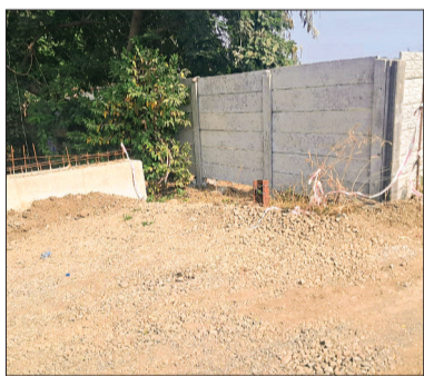
हरिभूमि न्यूज | सीहोर

हाउसिंग बोर्ड स्थित रेलवे गेट नंबर 104 पर बन रहा ओवरब्रिज अब विवादों के घेरे में आ गया है। ब्रिज कॉन्क्रीट और ठेकेदार द्वारा आनन-फानन में निर्माण पूरा कर यातायात शुरू करने की कोशिशों का स्थानीय रहवासियों ने कड़ा विरोध किया है। रहवासियों का आरोप है कि प्रशासन नियमों को ताक पर रखकर काम कर रहा है और उनकी वाजिब आपत्तियों का न्याकरण नहीं किया जा रहा है। वरिष्ठ नागरिक फोरम (सीनियर सिटीजन फोरम) के माध्यम से रहवासियों ने